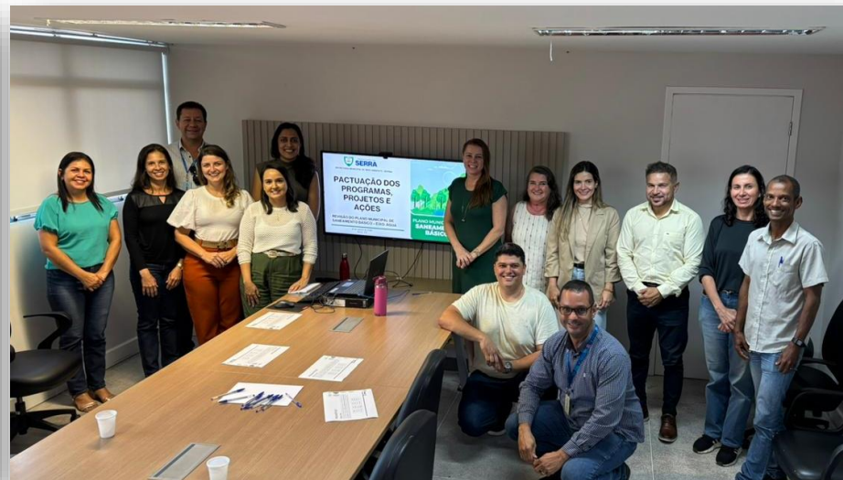
CESAN - ÁGUA