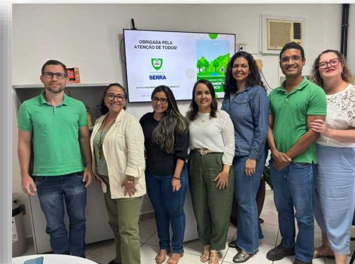
SESE – RESÍDUOS SÓLIDOS