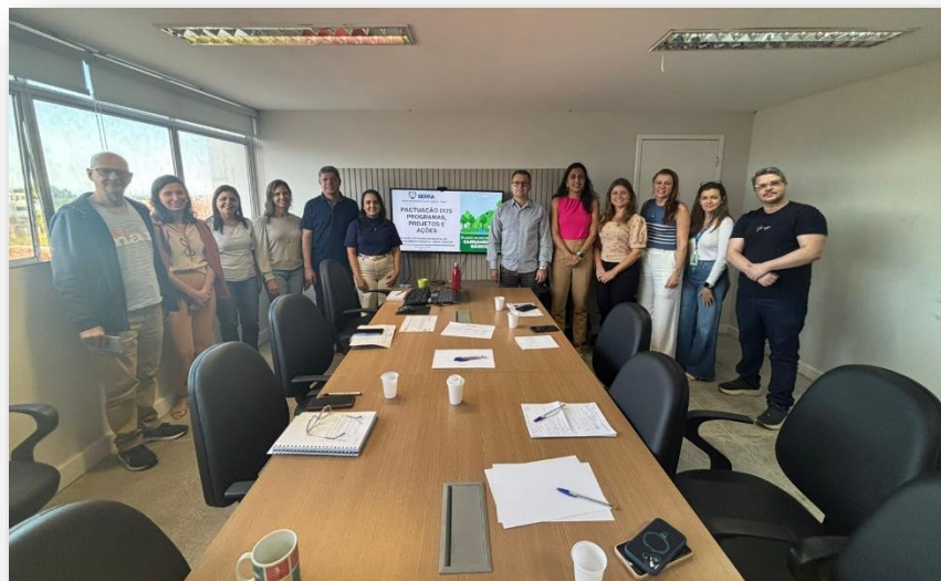
CESAN - ESGOTO